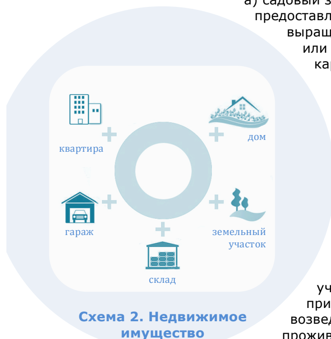
Схема 2. Недвижимое имущество